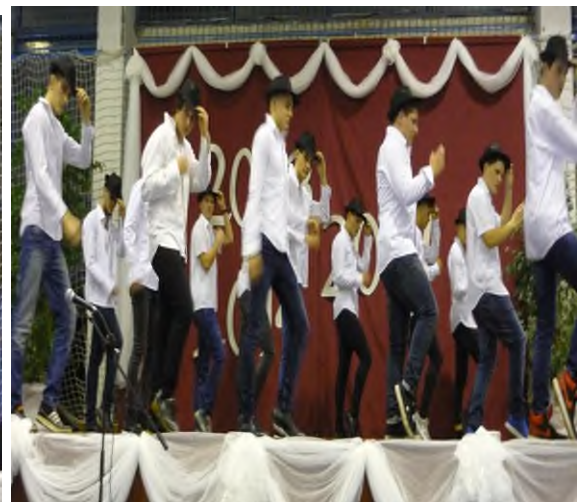
Szalagavató tánc: 12/4