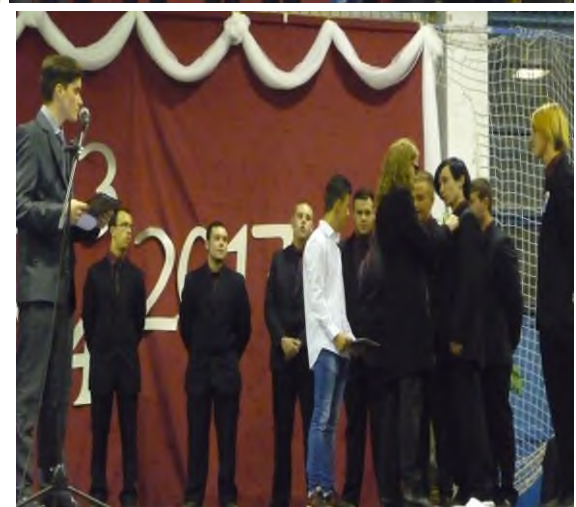
Szalagtűzés: 12/4, 3/11 K, M, F