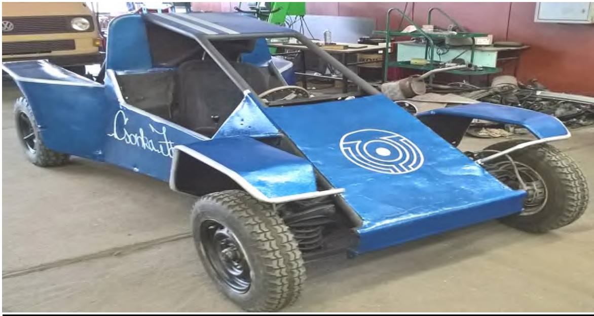
Részletek iskolánk saját kiállítási teréből az „Autótechnikán”